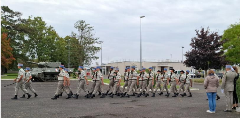
Participation à la cérémonie des remises de fourragères