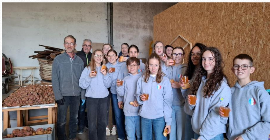
Calibrage des pommes de terre