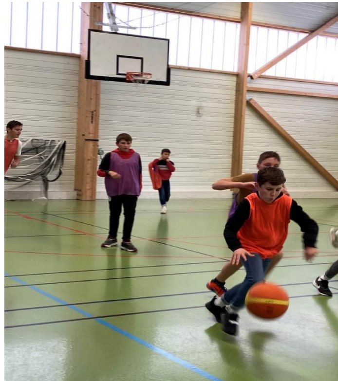
Foot et Futsal, basket