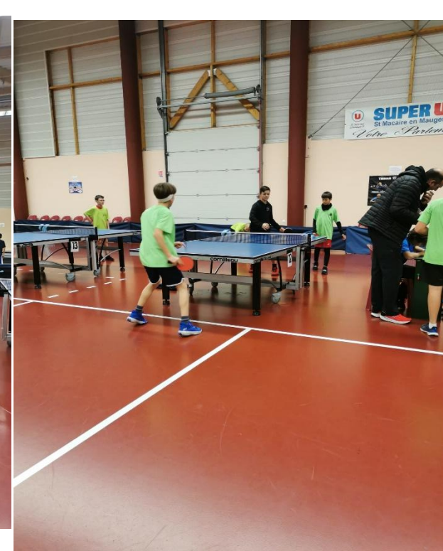
Tennis de table