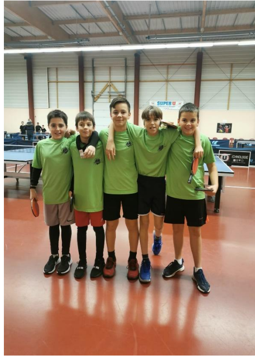
tennis de table