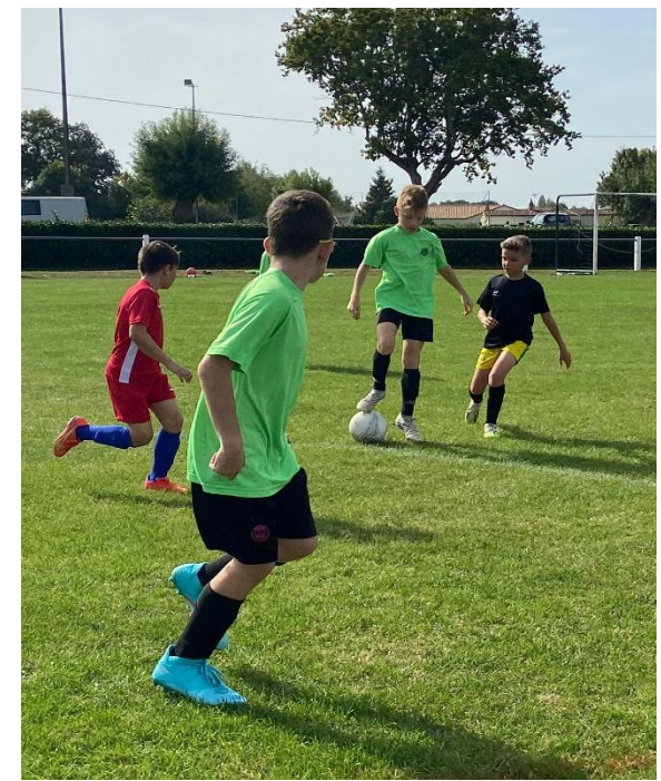
Foot à 7